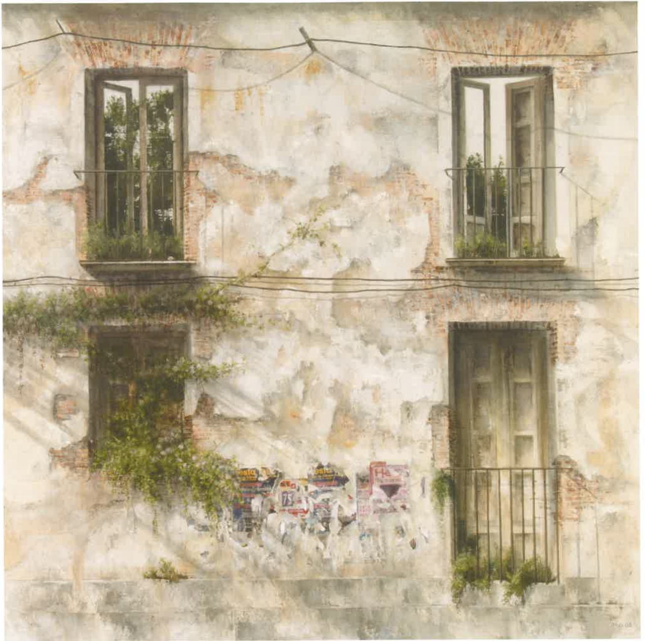
OLVIDO II Óleo sobre lienzo. 120 x 120 cm.