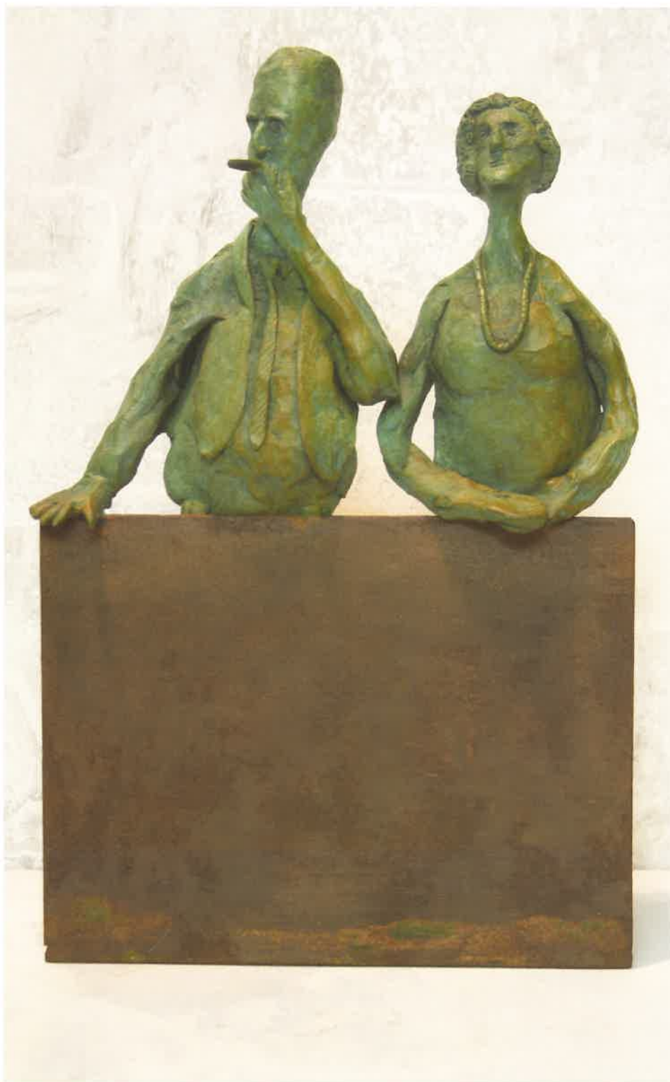
VIENDO EL DESFILE 21 x 15 x 32 cm.