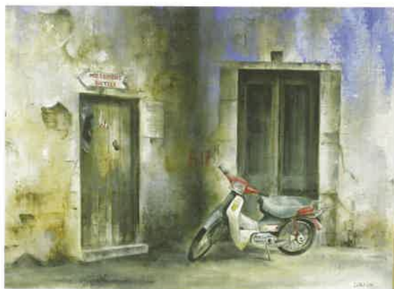
SIMI Óleo sobre lienzo. 67 x 46 cm.