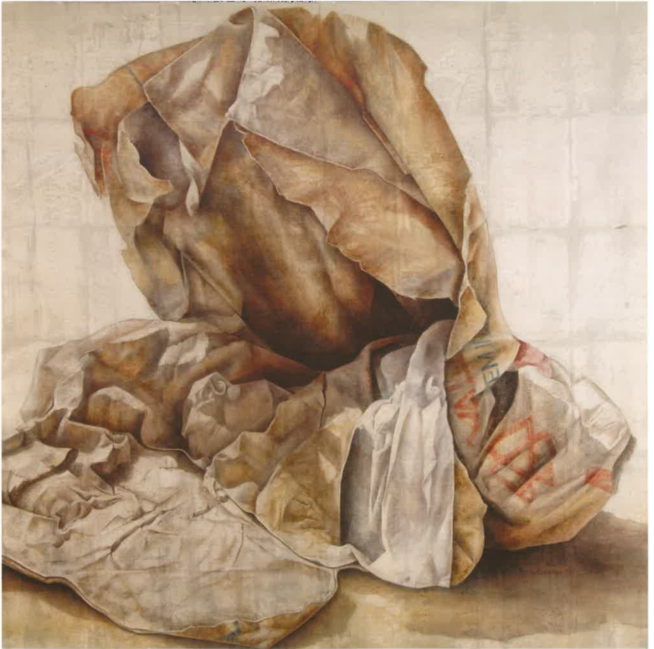
SACO DE CEMENTO Óleo sobre lienzo. 192 x 192 cm.