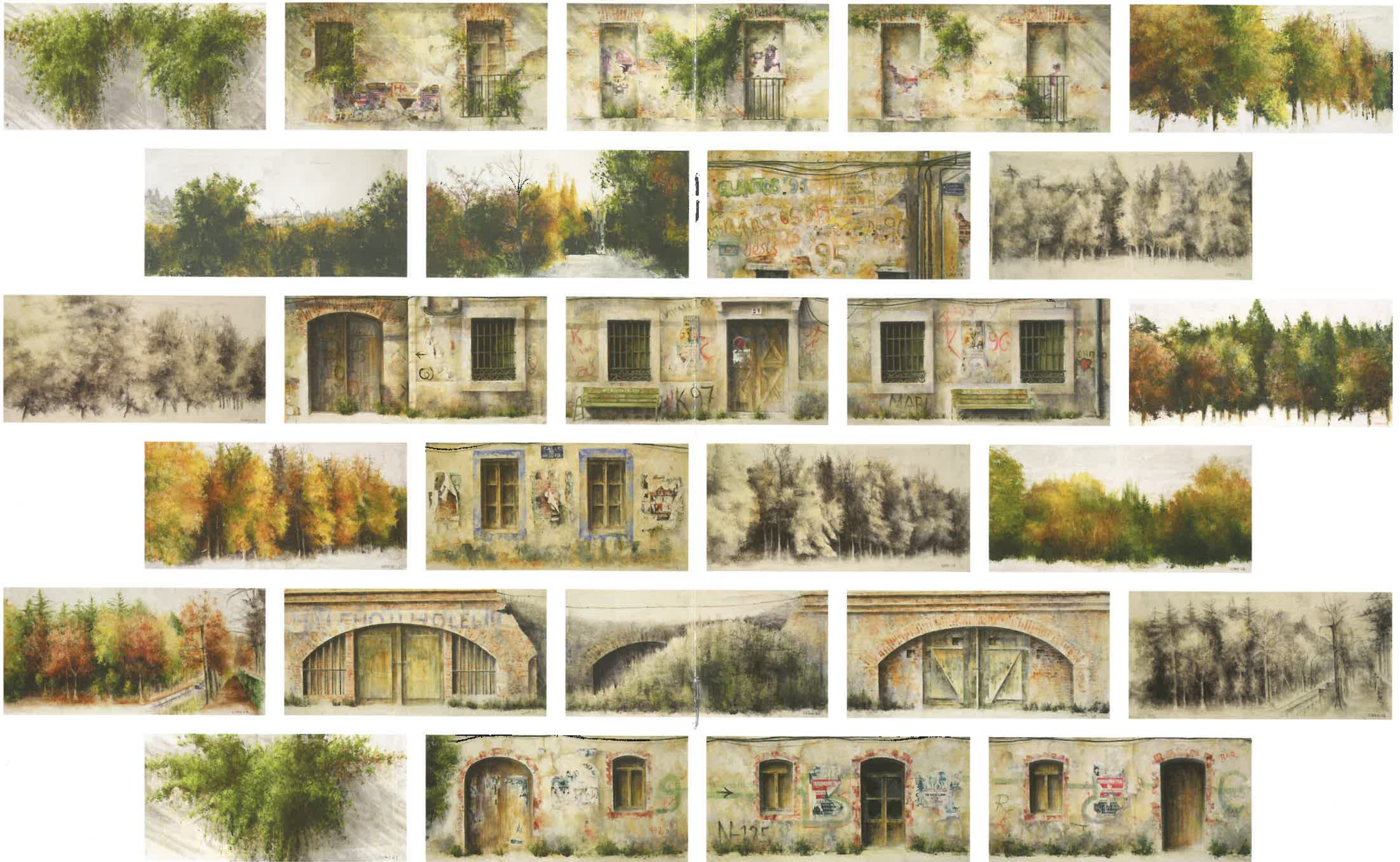
MURO (27 módulos). Óleo sobre tabla. 30 x 60 cm.