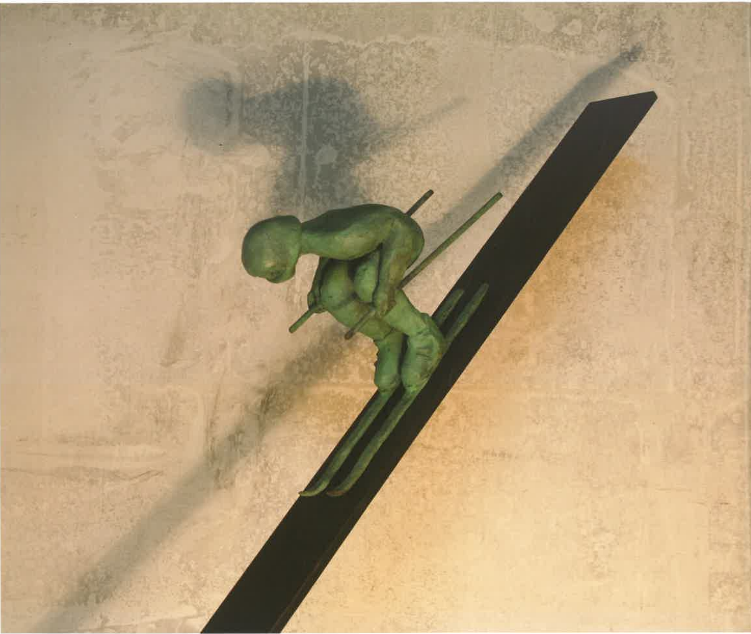
ALLÁ VOY 48 x 15 x 45 cm.