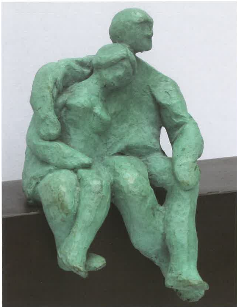
SON 25 AÑOS 10 x 12 x 17 cm.