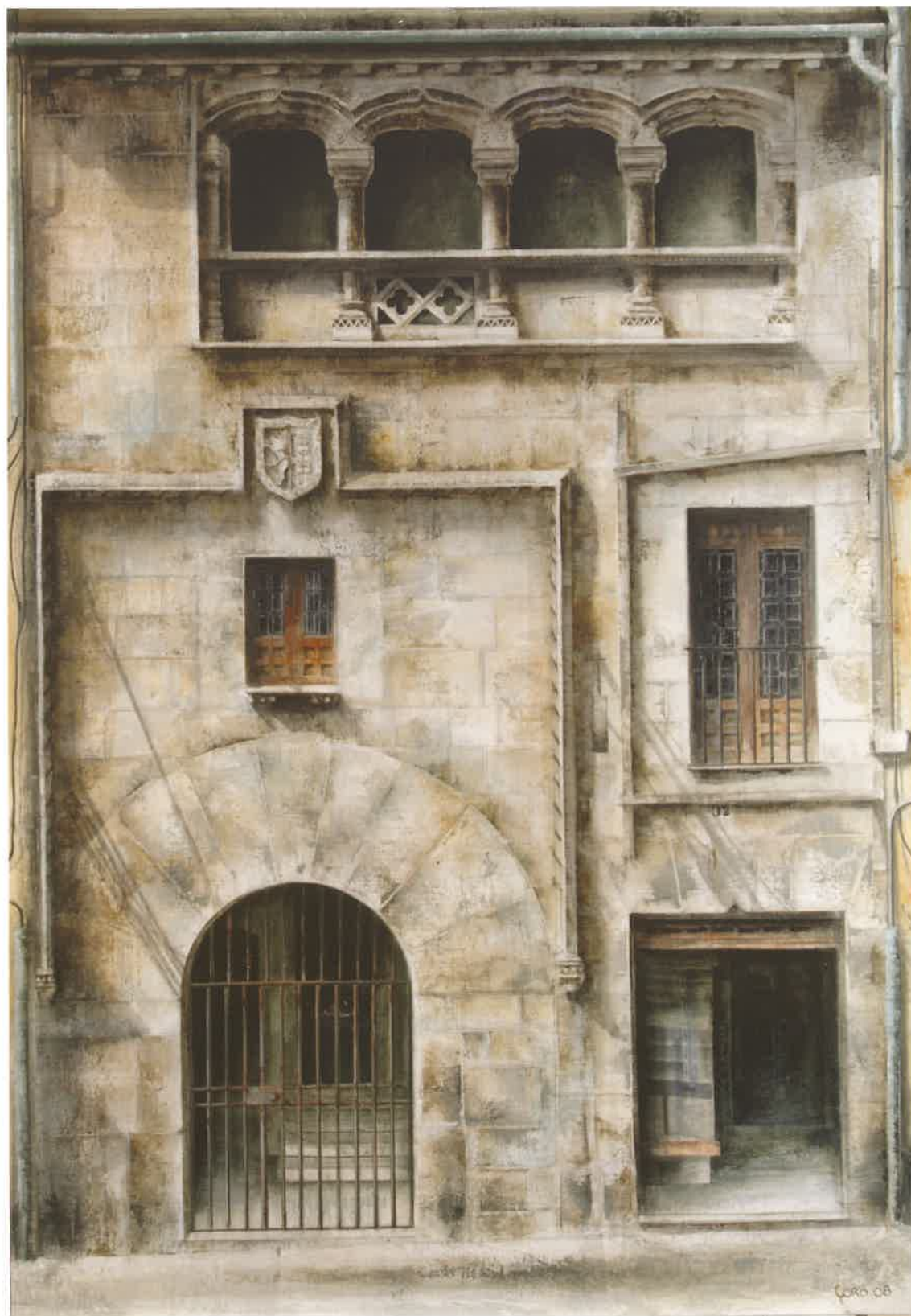
CASA DEL SIGLO.XV Óleo sobre lienzo. 116 x 81 cm.